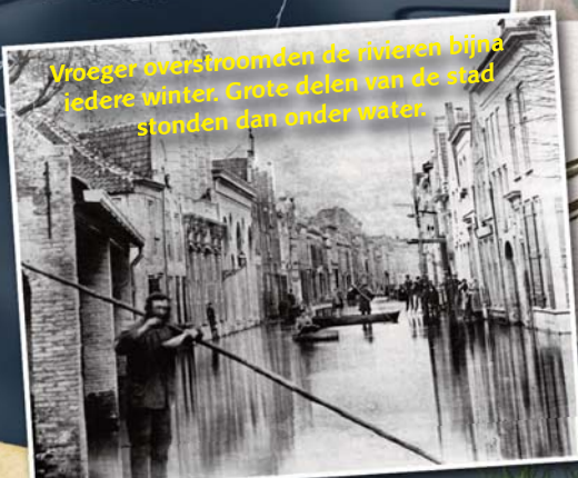
Vroeger overstroomden de rivieren bijna iedere winter. Grote delen van de stad stonden dan onder water.