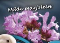
Er groeien bijzondere bloemen en planten langs de Dieze