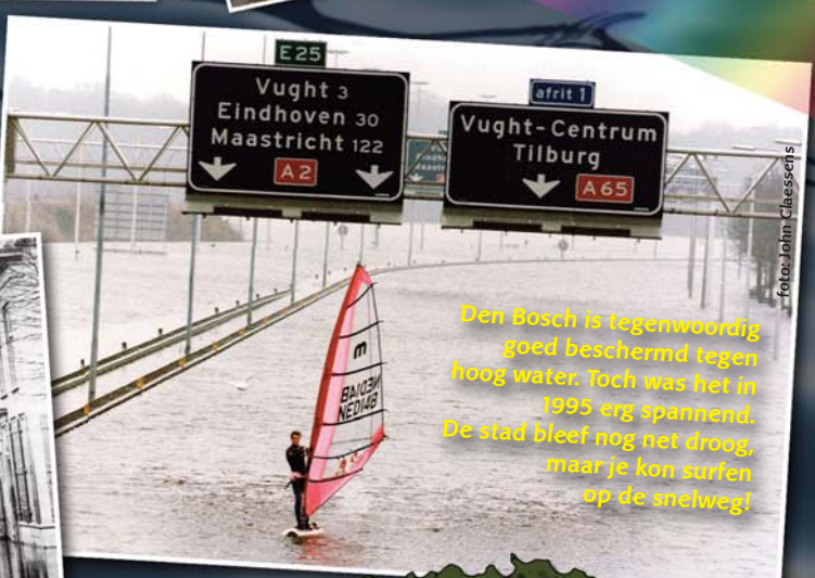
Den Bosch is tegenwoordig goed beschermd tegen hoog water. Toch was het in 1995 erg spannend. De stad bleef nog net droog, maar je kon surfen op de snelweg!